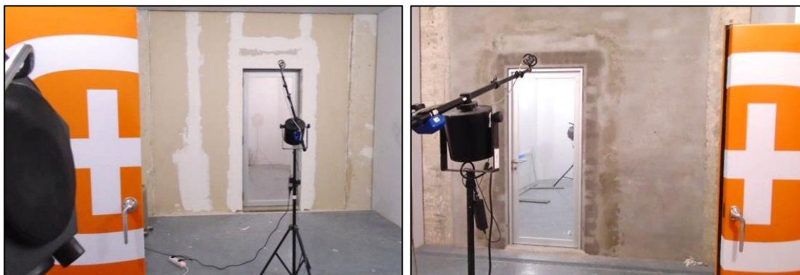
Imágenes 12 y 13 Muestra lista para ensayo

Las siguientes imágenes muestran la puerta lista para el ensayo, vista desde la sala emisora y desde la sala receptora, respectivamente.