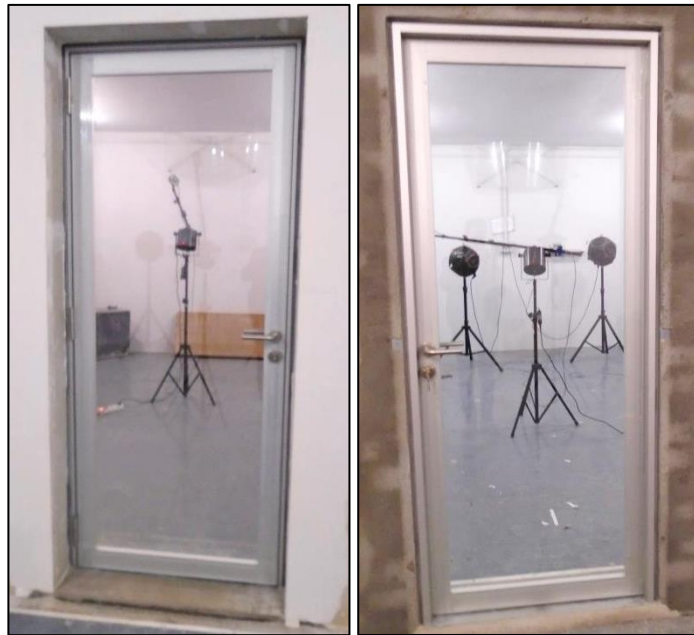
Imágenes 1 y 2 Puerta ensayada