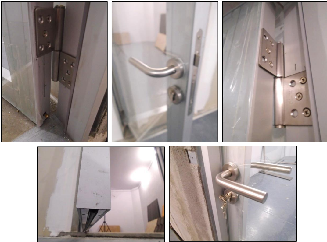
Imágenes 7 a 11 Detalles de la puerta ensayada: hoja

Las siguientes imágenes muestran la puerta lista para el ensayo, vista desde la sala emisora y desde la sala receptora, respectivamente.