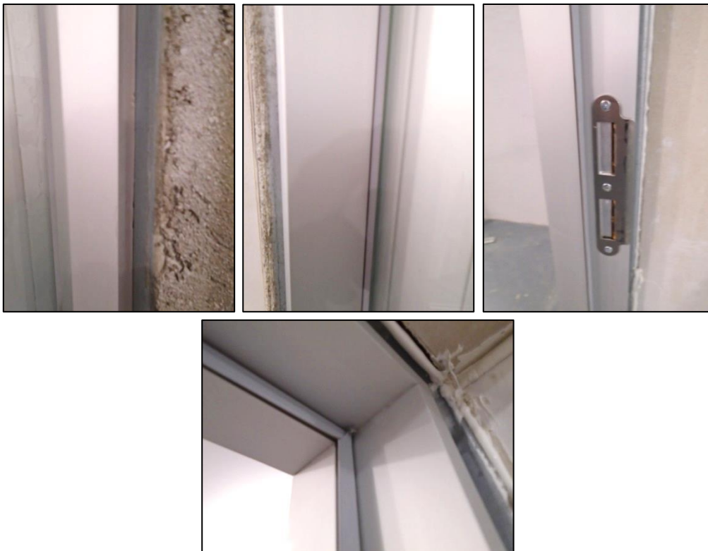
Imágenes 3 a 6 Detalles del marco