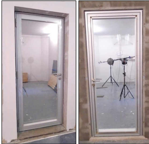
Imágenes 1 y 2 Puerta ensayada