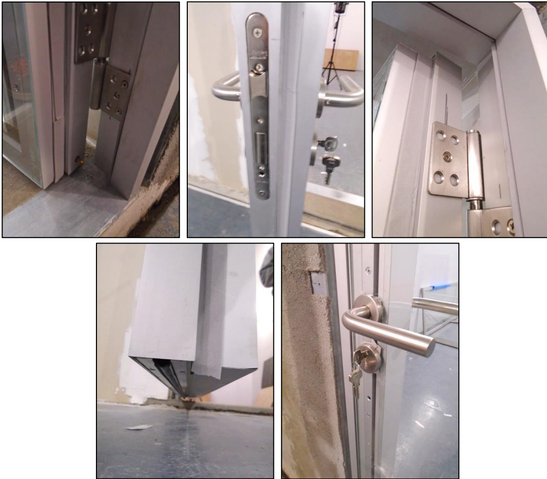
Imágenes 7 a 11 Detalles de la puerta ensayada: hoja

Las siguientes imágenes muestran la puerta lista para el ensayo, vista desde la sala emisora y desde la sala receptora, respectivamente.