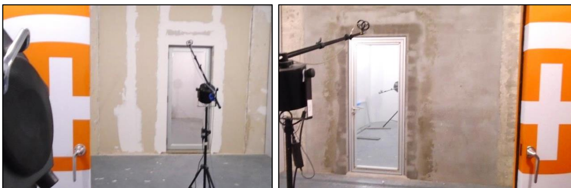
Imágenes 12 y 13 Muestra lista para ensayo

Las siguientes imágenes muestran la puerta lista para el ensayo, vista desde la sala emisora y desde la sala receptora, respectivamente.