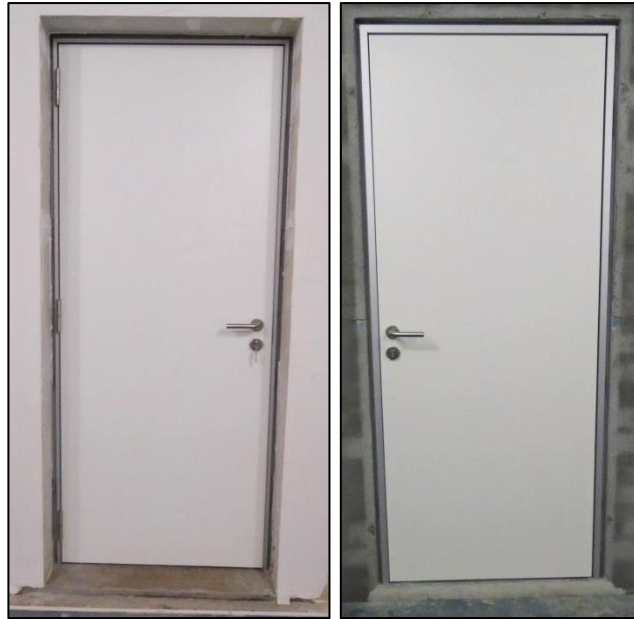
Imágenes 1 y 2 Puerta ensayada