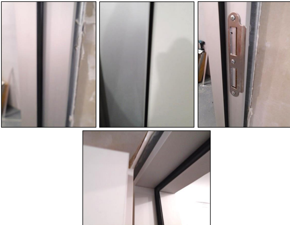
Imágenes 3 a 6 Detalles del marco