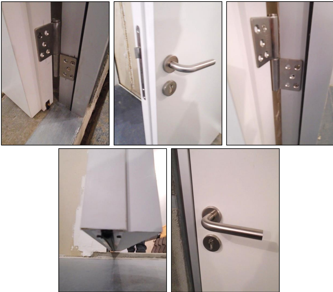
Imágenes 7 a 11 Detalles de la puerta ensayada: hoja

Las siguientes imágenes muestran la puerta lista para el ensayo, vista desde la sala emisora y desde la sala receptora, respectivamente.