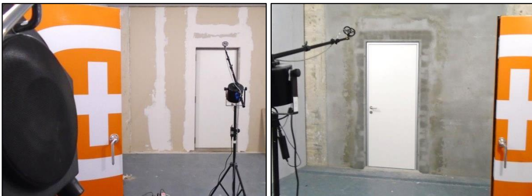
Imágenes 12 y 13 Muestra lista para ensayo

Las siguientes imágenes muestran la puerta lista para el ensayo, vista desde la sala emisora y desde la sala receptora, respectivamente.