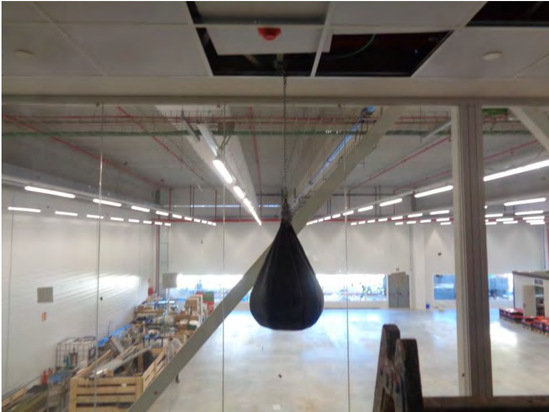
Fotografia 3: Muntatge de l'aparell d'assaig.