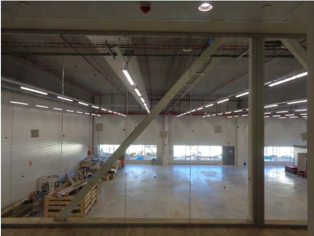
Fotografia 1: Vista del tram de la vidriera objecta de l'assaig.